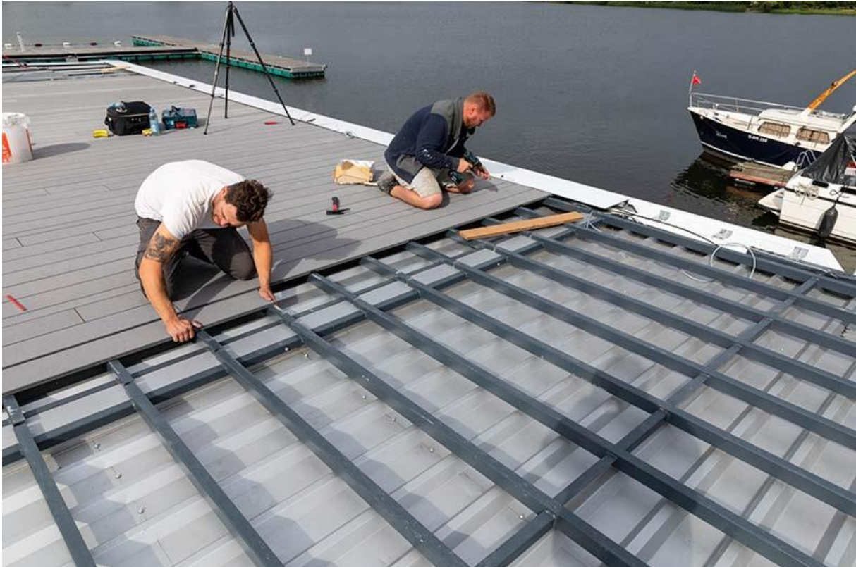
Das schwimmende, vollverglaste Loft bietet eine 360 Grad Aussicht und ist dank eigener Solar- und Wasseraufbereitungsanlage autark unterwegs.

Sanftes Grau, Tiefes Grau, Weicher Sand und Warmes Rot – die Farbkollektion aus vier verschiedenen erdigen Farbtönen wurden in Zusammenarbeit mit einem internationalen Team aus Landschaftsarchitekten entwickelt. Durch den natürlichen Alterungsprozess des Werkstoffs Faserzement – ein umweltfreundliches Gemisch aus Portlandzement und Wasser sowie organischen Fasern, die in ähnlicher Form auch in der Papierindustrie verwendet werden – nimmt die Terrasse nach und nach einen gleichmäßig sanften Ton in der gesamten Fläche an und bildet die perfekte Szenerie für Hochzeiten, Geburtstage oder Firmenevents auf dem Berliner Wannsee.